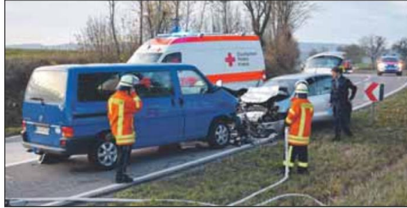
Beide Unfallbeteiligten konnten von Ersthelfern aus den Fahrzeugen gerettet werden. Die L 550 zwischen Hilsbach und Adelshofen war für einige Stunden gesperrt.

Die beiden Verletzten waren nicht eingeklemmt und konnten von Ersthelfern aus ihren Fahrzeugen gerettet werden. Nach notärztlicher Behandlung musste die Frau mit dem Rettungshubschrauber „Christoph 5“ aus Ludwigshafen in eine Klinik geflogen werden.